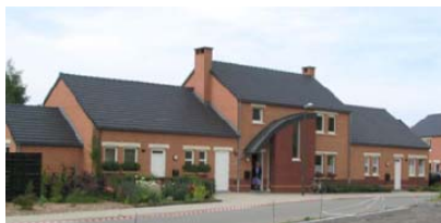
Logements intergénérationnels à Opprebaix (commune d'Incourt)

collectivité. La Commune de Fauvillers est engagée dans un CLT avec la Société de Logement Public pour créer 2 logements à Fauvillers.