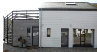
La maison médicale à Fauvillers.

Le potentiel foncier est peu contraignant mais le parc immobilier est très peu diversifié et relativement ancien. Les prix sont encore parmi les moins élevés de la région, mais en nette augmentation. Enfin, le logement public est présent et des projets sont en cours, notamment 2 logements en « Community Land Trust ».