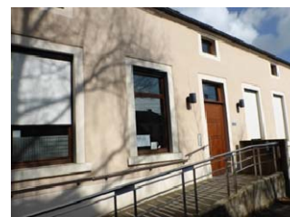
Le CPAS de Fauvillers

Malgré l'offre médicale présente, la population souhaiterait garantir son maintien