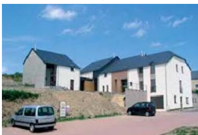
Logements tremplin à Martelange

Logement tremplin : un logement tremplin est un logement locatif mis à la disposition de jeunes ménages par une commune moyennant un loyer modéré. L'idée est de permettre aux jeunes de faire ainsi des économies et, endéans quelques années, de s'installer définitivement dans la commune en acquérant ou en construisant un logement. Une partie du loyer versé est restituée aux jeunes locataires en cas d'achat ou de construction d'un logement dans la même commune. C'est cette restitution qui constitue l'originalité fondamentale du système.