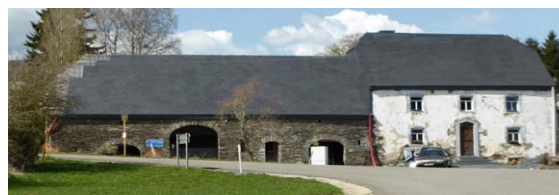
Bâtiment classé à l'IPIC dans le village de Menufontaine

La commune présente un patrimoine bâti très riche et diversifié (périmètre protégé, petit patrimoine, archéologie...), important en quantité et reconnu. Lors de la précédente Opération de Développement Rural, un inventaire du petit patrimoine a été réalisé.