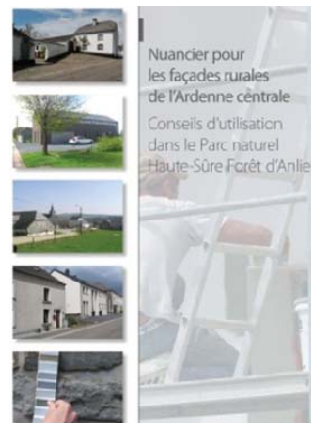
Le Nuancier des façades, référence spécifique pour l'Ardenne centrale

La population nuance le constat très positif concernant le patrimoine car certains éléments ne seraient pas répertoriés ou pas entretenus.