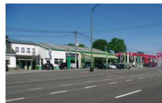
La ZAEM de Malmaison

Le problème foncier est vivement ressenti par les agriculteurs. Ils insistent sur la mauvaise qualité des sols renforcée par la sécheresse locale, la disparition des petites exploitations et les pratiques intensives et polluantes des Grand-Ducaux . Ces pratiques différentes sont également pointées du doigt par l'ensemble de la population, ainsi que l'insécurité